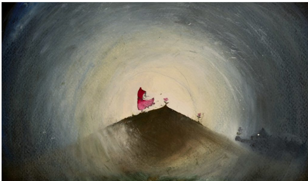
Locandina di Cappuccetto Rosso

rallenta a poco a poco la tensione e festeggiamo con loro, più forti, più grandi, sotto una pioggia dorata.