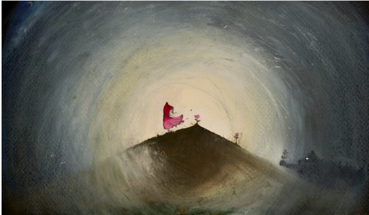
Locandina di Cappuccetto Rosso

Con lo stesso senso del rispetto e del coraggio la fiaba di Cappuccetto Rosso viene affrontata dal regista Michelangelo Campanale (coadiuvato dalle coreografie di Vito Cassano ), che già in alcuni dei suoi precedenti lavori ha dimostrato quanto per lui sia importante rispettare la verità della fiaba: conoscere la verità e saperla affrontare è l'unico modo per crescere. Un lupo, una bambina, il rosso e il nero, una rosa e un gruppo di danzatori-acrobati. La messinscena di Campanale è un vero e proprio show che coinvolge e rapisce, ma dietro le luci, la musica, le danze frenetiche, si consuma una delle più ambigue delle fiabe: un lupo inganna una bambina e la divora. È un lupo antropomorfizzato quello di Campanale, un uomo elegante che sa danzare con leggerezza, ma che alla vista della bambina non sa reprimere i propri istinti animaleschi. Si rivolge anche a un